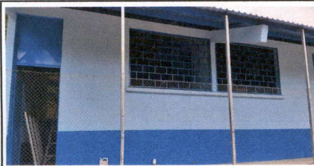
Foto 1: Pintura de paredes, mantenimiento de puertas y mantenimiento de balcones.