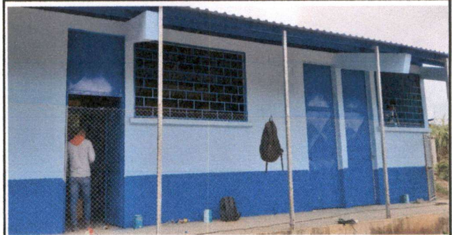
Foto 2: Pintura de paredes, mantenimiento de puertas y mantenimiento de balcones.