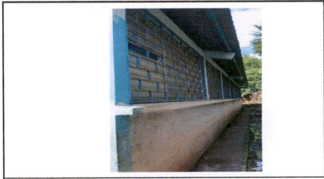
Foto 2: Se necesita pintura de paredes y mantenimiento de balcaones.