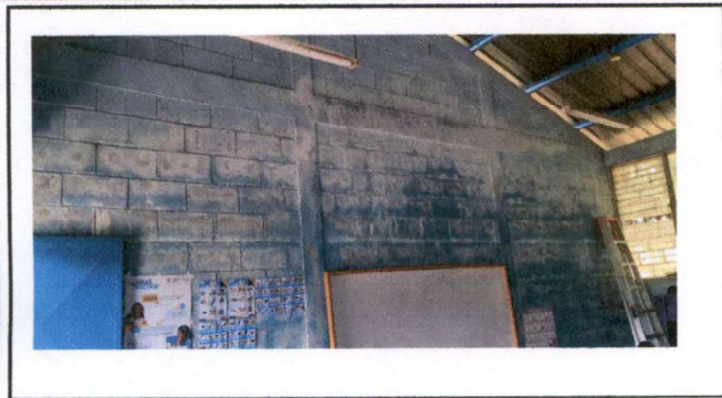
Foto1: Se necesita pintura de paredes.