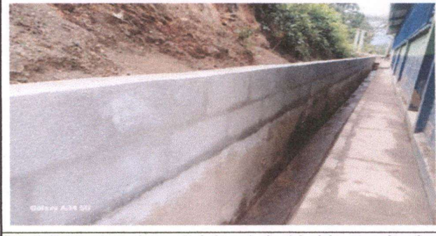
Foto 6: Mejoramiento de cuneta de la parte de atrás del centro educativo.

Observación: Si es necesario se pueden agregar hojas adicionales y actualizar el número de hojas.