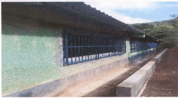
Foto1: Balcones de las ventanas de atrás del centro educativo.