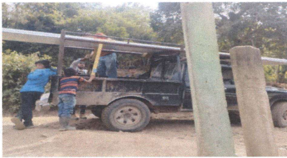
Foto1: ingreso del matrial al centro educativo.