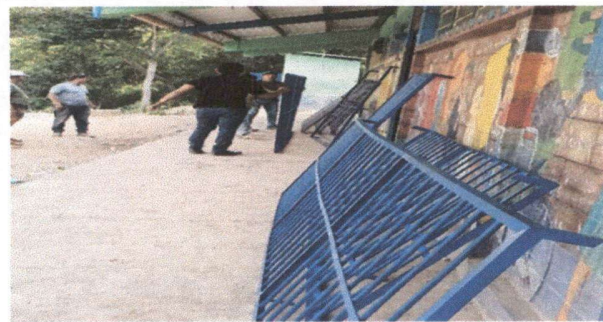
Foto 5: Traslado de los balcones al centro educativo para la instalación.