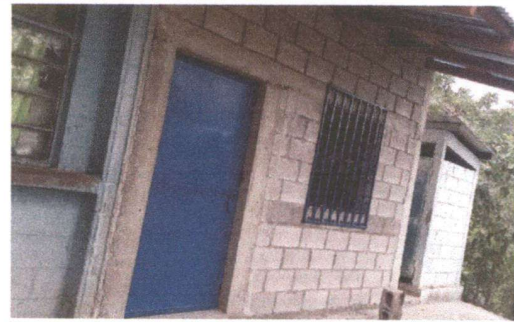
Foto 4: puerta y balcón ya colocados en el espacio que antes solo habían las bases.