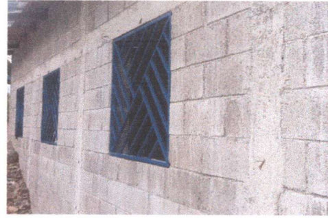
Foto 2: balcones del aula ya colocados, éste es por la parte de atrás por donde está el oratorio.