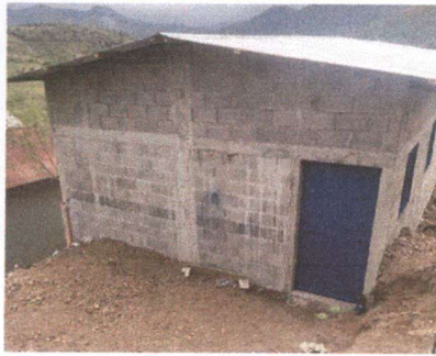
Foto 1: muro perimetral y aula ya completada, con torta de cemento, puertas y balcones.