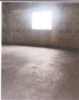
Foto 5: torta de cemento concluida, en el aula donde anteriormente solo habían bases con piso de tierra.