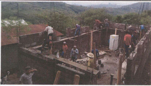
Foto 1: padres de familia trabajando parte del muro perimetral que divide la escuela y el oratorio.