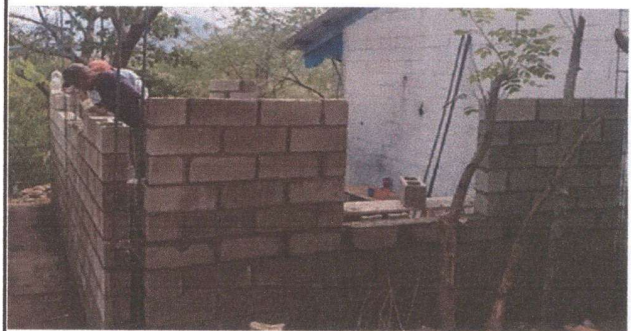
Foto 4: padres de familia trabajando en el aula que solamente tenía sus bases.