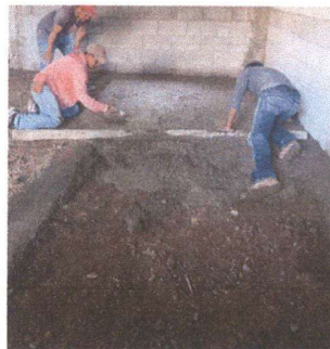
Foto 6: padres de familia colocando torta de cemento en el aula donde anteriormente tenía paredes de nylon.

Observación: Si es necesario se pueden agregar hojas adicionales y actualizar el número de hojas.