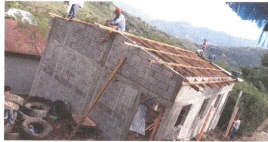
Foto 2: padres de familia colocándole techo al aula que antes era de nylon