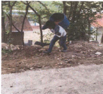
Foto 3: joven trabajando para luego colocar la torta de cemento en el patio