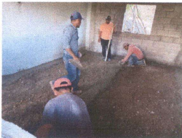
Foto 5: padres de familia colocando torta de cemento en el área donde solo estaban las bases.