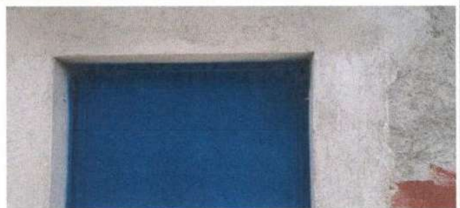
SUSTITUCIÓN DE PUERTA

Observación: Si es necesario se pueden agregar hojas adicionales y actualizar el número de hojas.