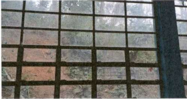
SUSTITUCION DE VIDRIOS