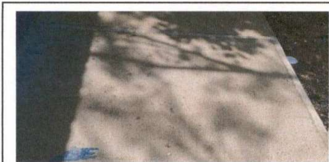
REPARACIÓN DE PISO POR TORTA DE CONCRETO