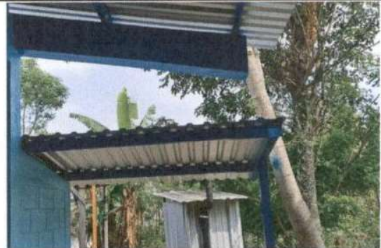
SUSTITUCIÓN DE LÁMINA, POR LÁMINA TROQUELADA