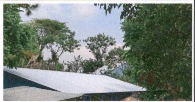
SUSTITUCIÓN DE LÁMINA, POR LÁMINA TROQUELADA