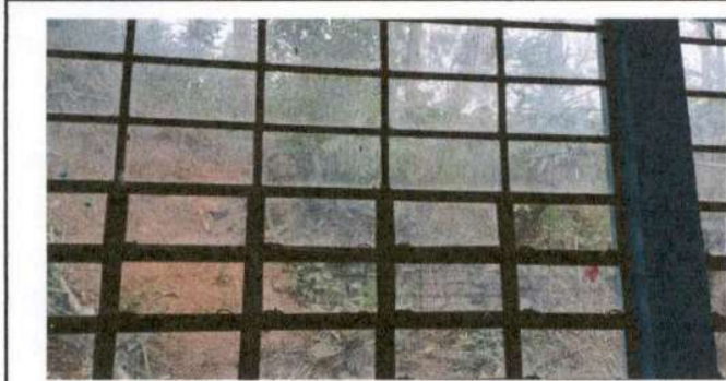
SUSTITUCION DE VIDRIOS