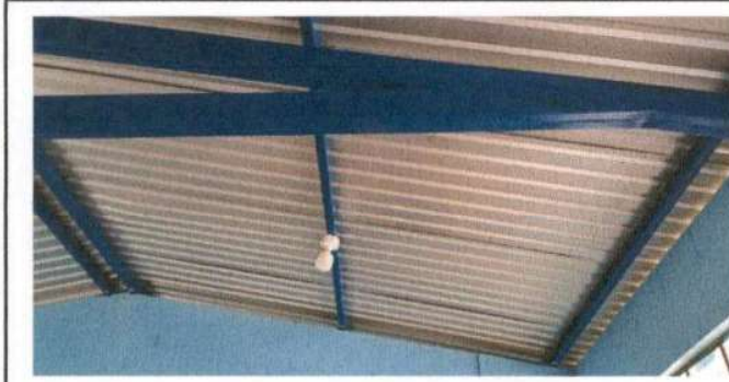
REPARACIÓN DE LÁMPARAS