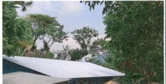
SUSTITUCIÓN DE LÁMINA, POR LÁMINA TROQUELADA