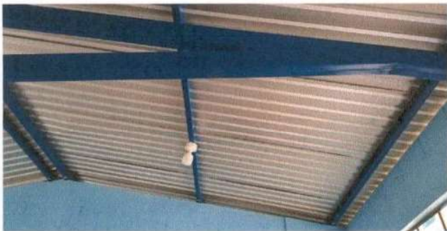
REPARACIÓN DE LÁMPARAS