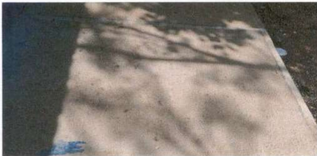
REPARACIÓN DE PISO POR TORTA DE CONCRETO