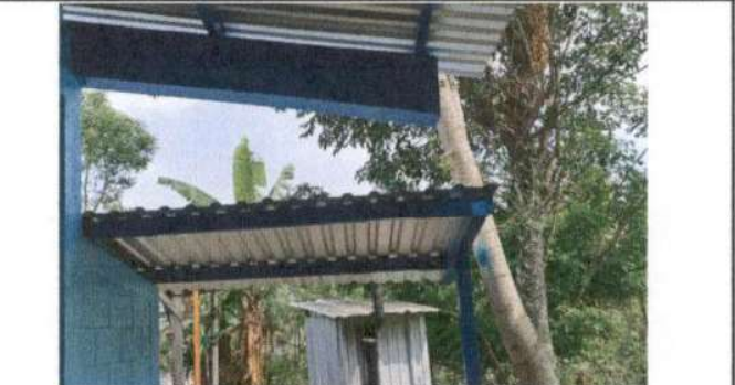
SUSTITUCIÓN DE LÁMINA, POR LÁMINA TROQUELADA