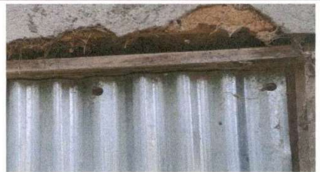
SUSTITUCIÓN DE PUERTA

Observación: Si es necesario se pueden agregar hojas adicionales y actualizar el número de hojas.