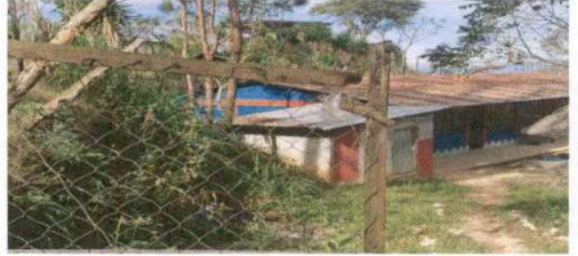
SUSTITUCION DE LAMINA, POR LÁMINA TROQUELADA