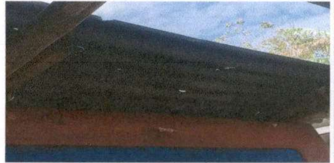
SUSTITUCIÓN DE LÁMINA, POR LÁMINA TROQUELADA