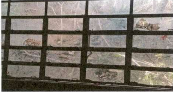
SUSTITUCIÓN DE VIDRIOS