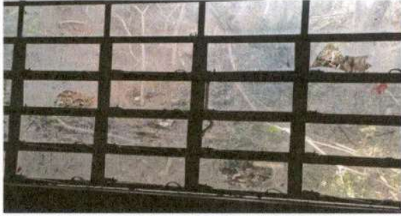
SUSTITUCIÓN DE VIDRIOS