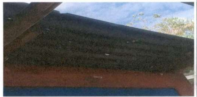
SUSTITUCIÓN DE LÁMINA, POR LÁMINA TROQUELADA