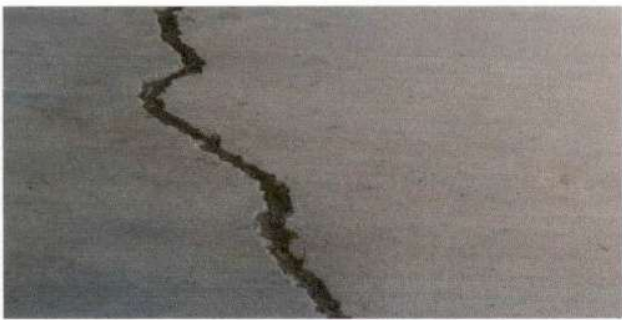
REPARACIÓN DE PISO POR TORTA DE CONCRETO