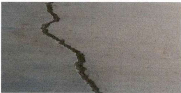
REPARACIÓN DE PISO POR TORTA DE CONCRETO