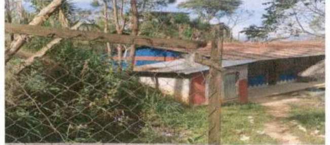
SUSTITUCION DE LAMINA, POR LÁMINA TROQUELADA