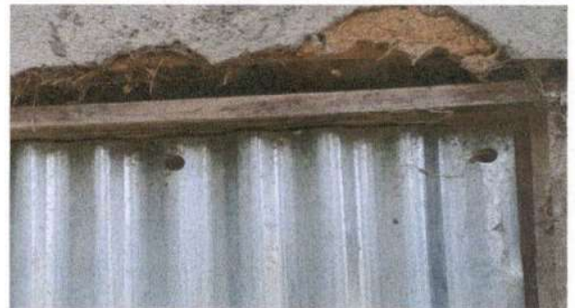
SUSTITUCIÓN DE PUERTA

Observación: Si es necesario se pueden agregar hojas adicionales y actualizar el número de hojas.