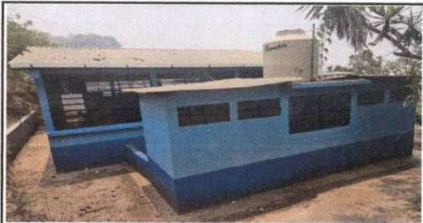
Foto 6: Suministro de 85 M2 de pintura para los baños y suministro de un tinaco

Observación: Si es necesario se pueden agregar hojas adicionales y actualizar el número de hojas.