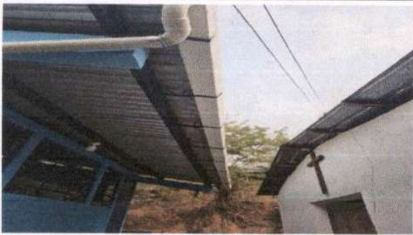
Foto 3: Sustrucción de 16 ML bajadas de agua pluvial de metal por tubo PVC