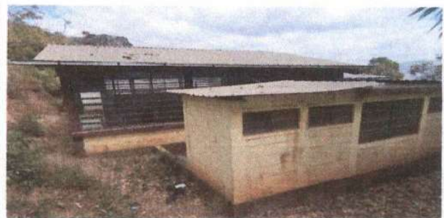
Foto 6: Suministro de 85 M2 de pintura para los baños y suministro de un tinaco.

Observación: Si es necesario se pueden agregar hojas adicionales y actualizar el número de hojas.