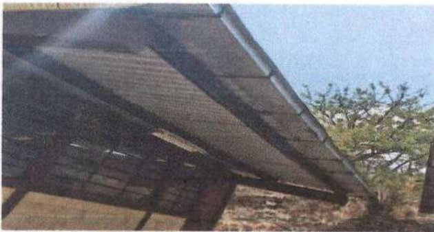
Foto 3: Sustrucción de bajadas de agua pluvial de metal por tubo PVC