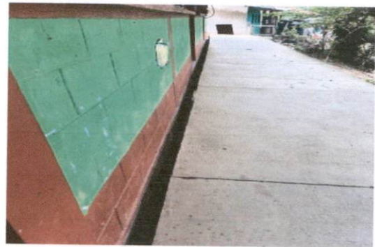
Foto:10 Separación banqueta y pared