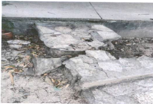
Foto:9 Rampa de Acceso