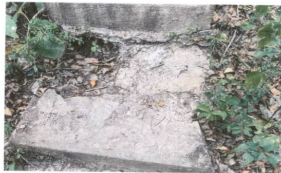
Foto:12 Rampa de Acceso

Observación: Si es necesario se pueden agregar hojas adicionales y actualizar el número de hojas.