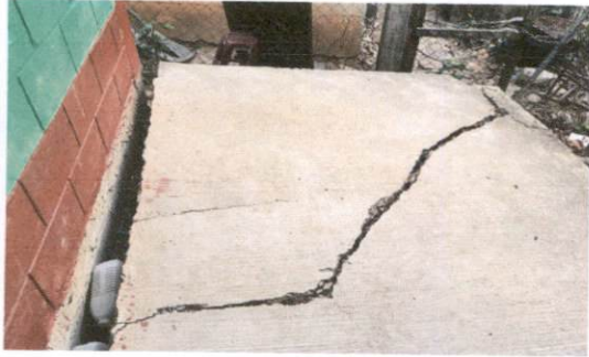
Foto:7 Hendidura banqueta