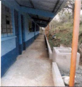
Foto 1: . Pintura fachada exterior, Plancha y Pila, Pretil en la parte frontal