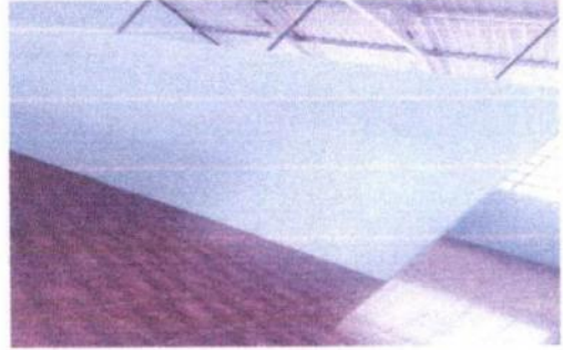
Foto 2: Ceramico , cambio de division y pintura en el centro educactivo.