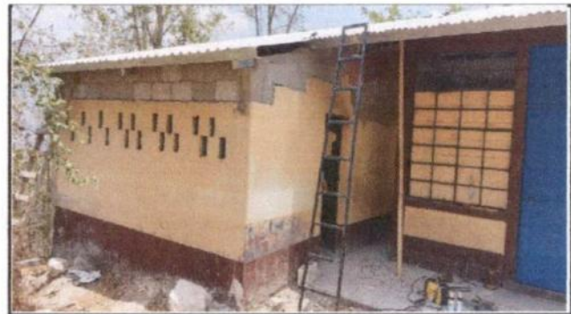
Foto : Reparación de Techo de Cocina y Paredes.