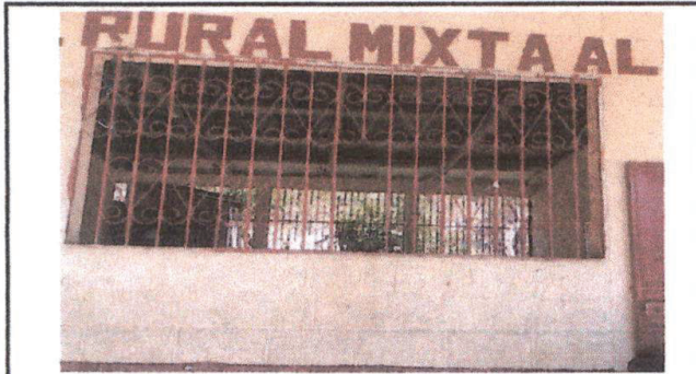
Balcones necesitan mantenimiento. Cambio de varillas de acero dañadas y aplicacion de pintura anticorrosiva