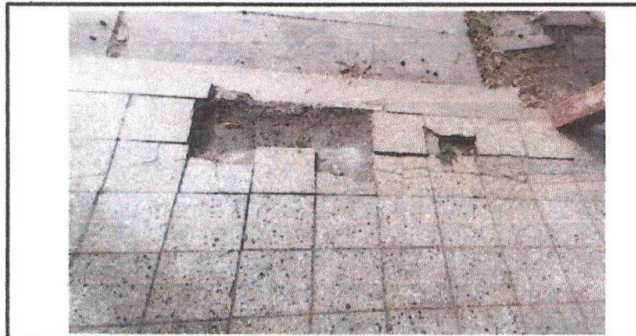
Piso de granito actualmente en mal estado