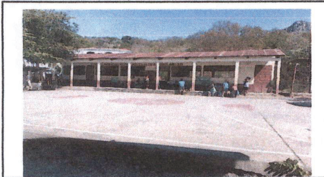
Vista de frente de Escuela, no tiene ventanas y balcones necesitan mantenimiento