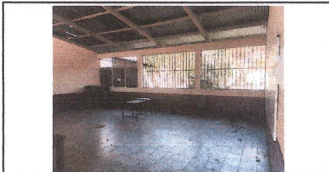
Piso de granito en mal estado

Observación: Si es necesario se pueden agregar hojas adicionales y actualizar el número de hojas.