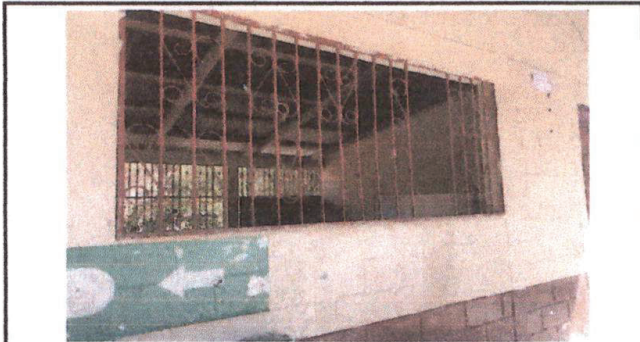
Balcones necesitan mantenimiento. Cambio de varillas de acero dañadas y aplicacion de pintura anticorrosiva