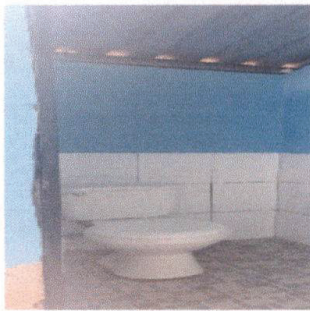
Foto 3: El baño ciego que estaba inservible fue eliminado para mejorar el aspecto de los inodoros nuevos.