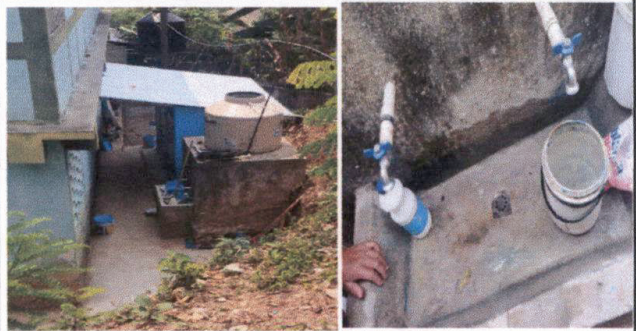
Foto 4: La tubería de agua para uso diario de nuestros niños esta siendo mejorada.