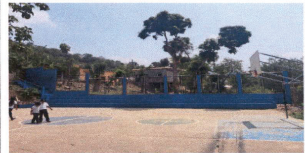
Foto 6: Las gradas de la cancha estan siendo remodeladas totalmente de igual forma la malla que protege a nuestra escuela.

Observación: Si es necesario se pueden agregar hojas adicionales y actualizar el número de hojas.