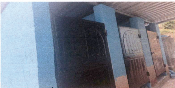
Foto 5: Las puertas del servicio sanitario se les esta dando un reforzamiento con el mantenimiento.