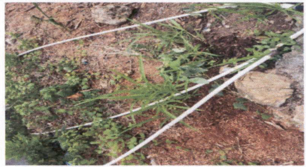
Foto 2: La tubería de los inodoros esta siendo cambiada totalmente.