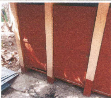
avance un 20% el trabajo de mantenimiento a puertas de sanitarios

Observación: Si es necesario se pueden agregar hojas adicionales y actualizar el número de hojas.