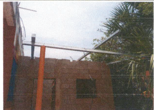
avance en un 50% el trabajo de sustitución de madera por estructura de metal en techo de cocina