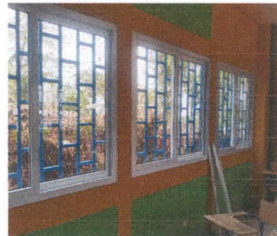
avance en un 80% el trabajo de ventanas en aulas de primaria