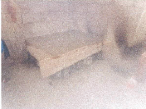
avance en un 60% el trabajo de sustitución de hornillas de block por estufa rural