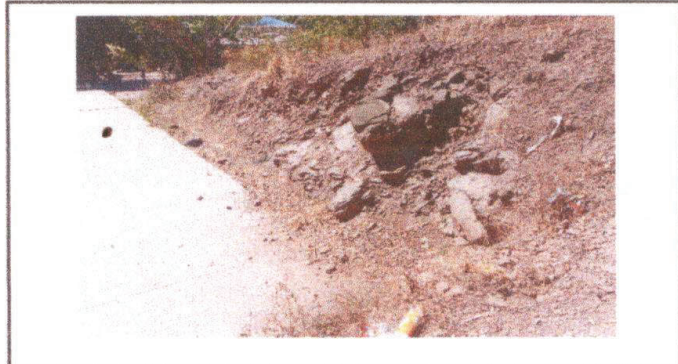
Área a mejorar con una sección de muro perimetral