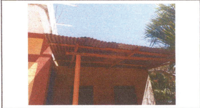
Área del techo de cocina que se mejorará