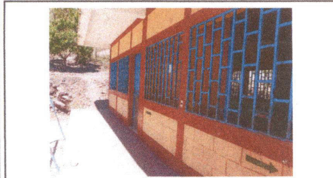
Área de ventanas que se mejorará