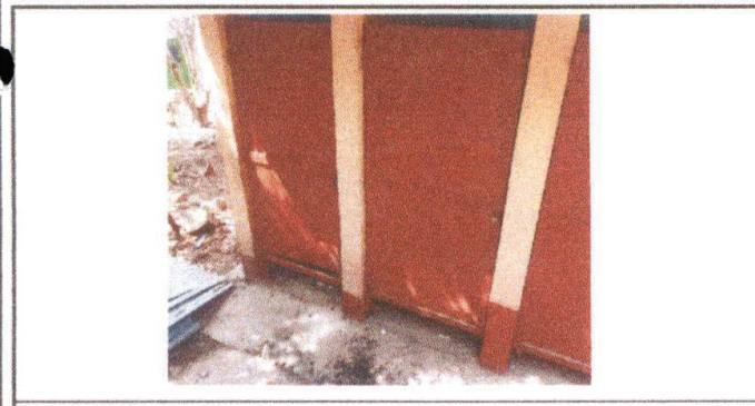
Área de baños a mejorar