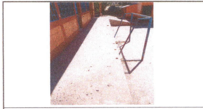
Área a mejorar con baranda metálica

Observación: Si es necesario se pueden agregar hojas adicionales y actualizar el número de hojas.