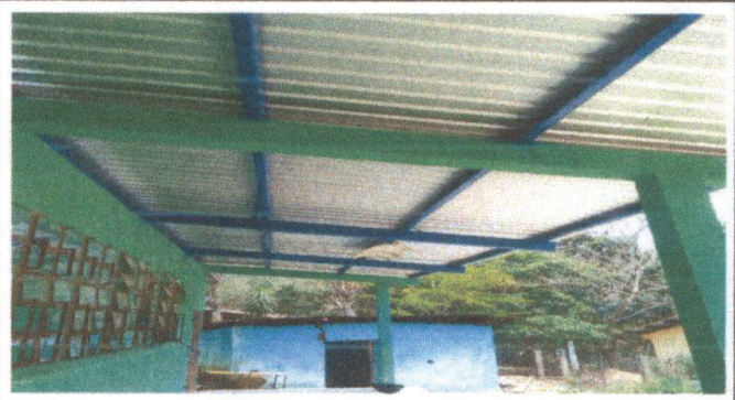
Foto: Techo del edificio escolar