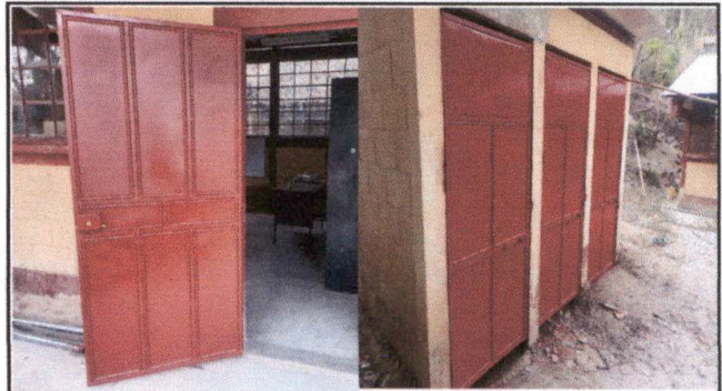
FOTO 2: Mantenimiento a estructura de puertas (lijado, cambio de tubo, cepillado, sujecciones, aplicación de pintura)