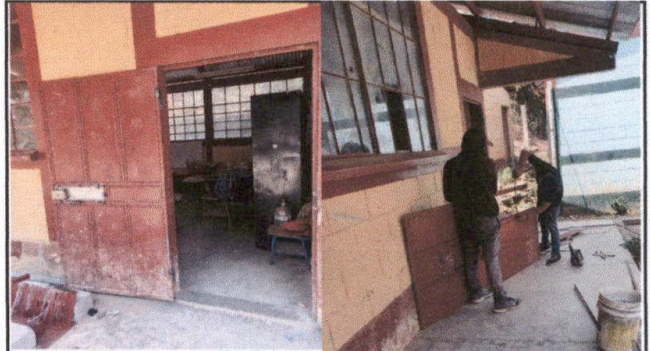
FOTO 2; Mantenimiento a estructura de puertas (lijado, cambio de tubo, cepillado, sujecciones, aplicación de pintura)