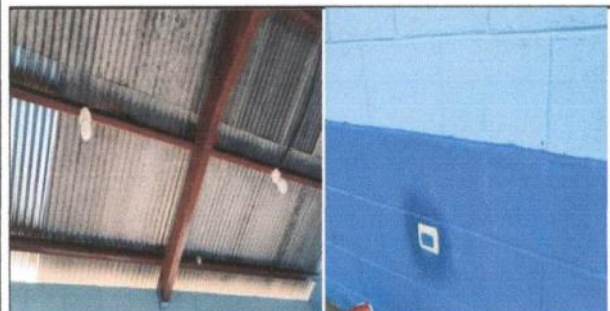
Foto 5: Sustitución de lámparas por plafoneras, tomacorriente y cableado eléctrico culminado