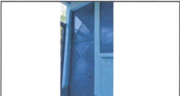
Foto2: Mantenimiento a estructura de puertas culminado