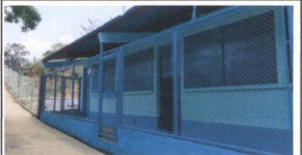
Foto 4: Muro perimetral que incluye la reparación de pasillo culminado