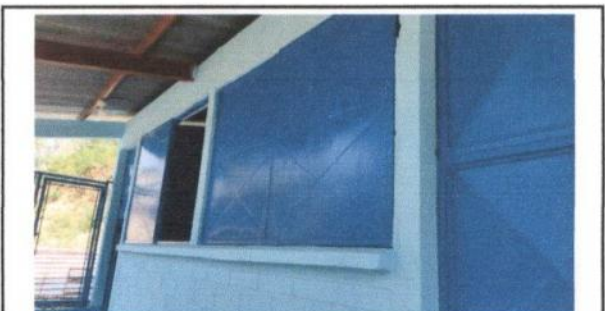
Foto 6: Sustitucion de ventanas por ventanas corredizas de metal culminado

Observación: Si es necesario se pueden agregar hojas adicionales y actualizar el número de hojas.