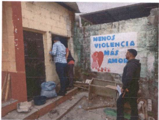
Foto 3: se harán reparaciones y se utilizará para cocina, también se instalará una estufa dentro del espacio