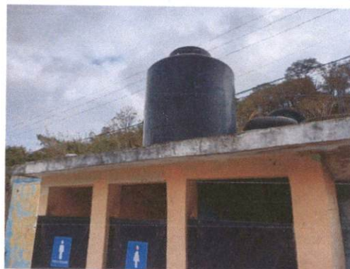
Foto 4: Cambio de tinaco y cambio de tubería en el sistema del agua