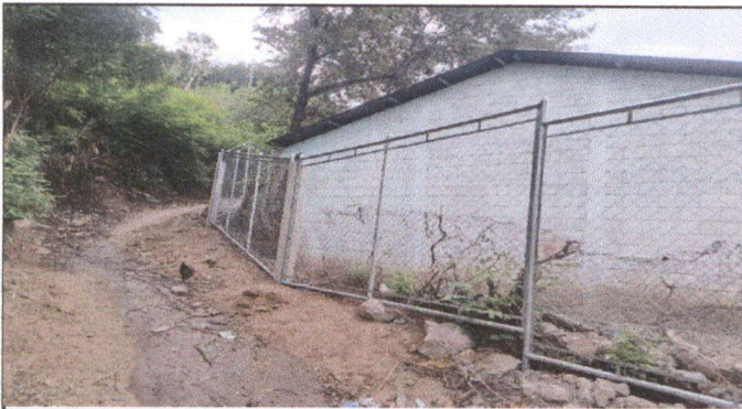
Foto 3: SUSTITUCIÓN DE MALLA Y TUVO GALVANIZADO EN EL MURO PERIMETRAL (MURO EXISTENTE)