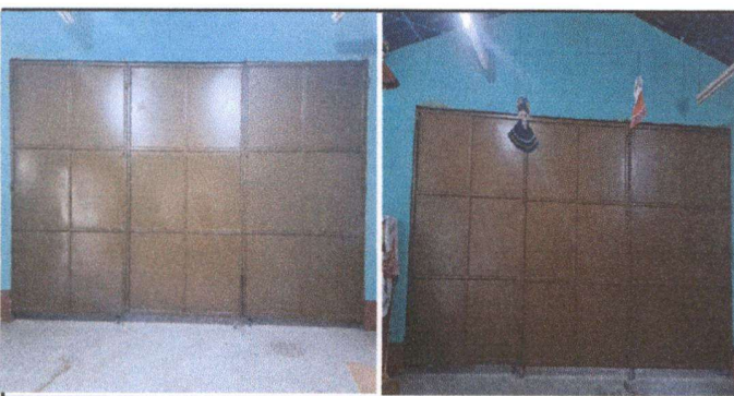
Foto 5: AULA 1 Y 2 MANTENIMIENTO A ESTRUCTURA 2 DIVISIONES (LIJADO Y APLICACIÓN DE PINTURA)