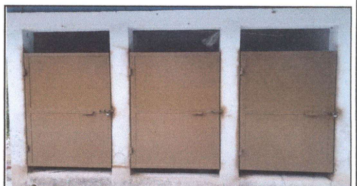
Foto 6: MANTENIMIENTO A ESTRUCTURA PUERTAS DE SANITARIOS (LIJADO Y APLICACIÓN DE PINTURA)

Observación: Si es necesario se pueden agregar hojas adicionales y actualizar el número de hojas.