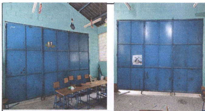
Foto 5: AULA 1 Y 2 MANTENIMIENTO A ESTRUCTURA 2 DIVISIONES (LIJADO Y APLICACIÓN DE PINTURA)