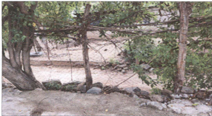
Foto 3: SUSTITUCIÓN DE MALLA Y TUBO GALVANIZADO EN EL MURO PERIMETRAL (MURO EXISTENTE)