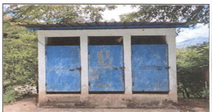
Foto 6: MANTENIMIENTO A ESTRUCTURA PUERTAS DE SANITARIOS (LIJADO Y APLICACIÓN DE PINTURA)

Observación: Si es necesario se pueden agregar hojas adicionales y actualizar el número de hojas.