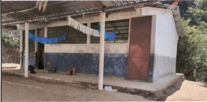
Foto1: Con pintura en mal estado con necesidad de aplicar pintura, en interior y exterior.