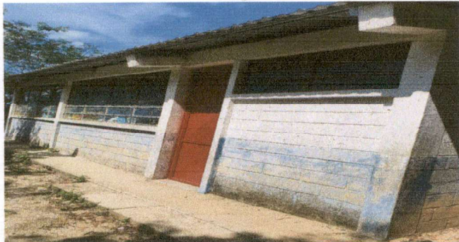
Foto 8: Pintintura en mal estado con necesidad de aplicar pintura en interior y exterior.