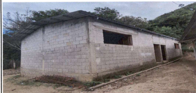
Foto 5: Aula con necesidad de aplicación de repello solera de humedad.