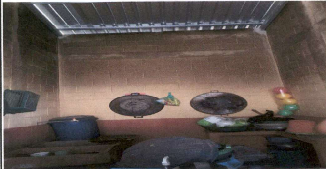
Foto 3: Cocina con necesidad de aplicar pintura en interior y exterior