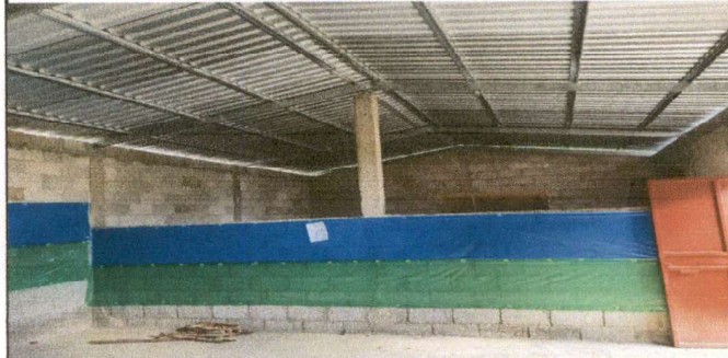
Foto 6: Continuación de pared existente en Aula No. 2 pared Intermedia.

Observación: Si es necesario se pueden agregar hojas adicionales y actualizar el número de hojas.