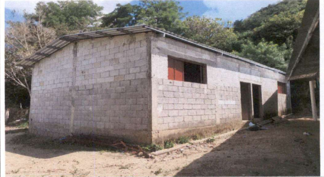
Foto 2: aula sin pintura con necesidad de aplicar pintura en interior y exterior