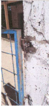
Foto1: Portón principal