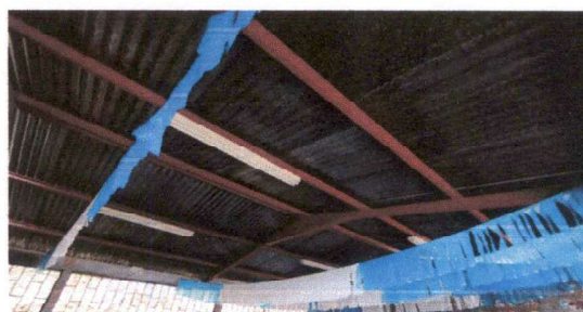
SUSTITUCIÓN DE LÁMINA

Observación: Si es necesario se pueden agregar hojas adicionales y actualizar el número de hojas.