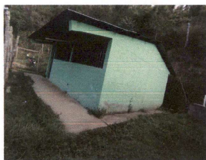
REPARACIÓN DE PLANCHAS DE CONCRETO DE PATIO