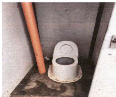
SUSTITUCION DE INODOROS