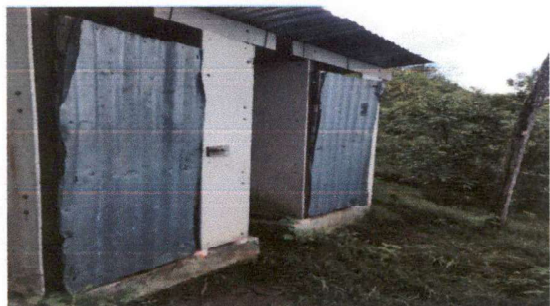
AMPLIACIÓN DE MURO PERIMETRAL DE BLOCK