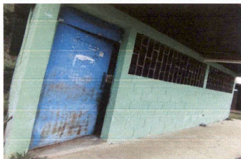
SUSTITUCIÓN DE PUERTA DE METAL