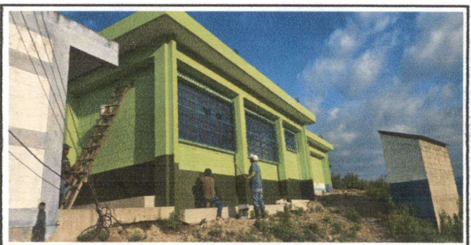
Foto 6: Reparación de los cristales del ventanal y aplicación de pintura.

Observación: Si es necesario se pueden agregar hojas adicionales y actualizar el número de hojas.