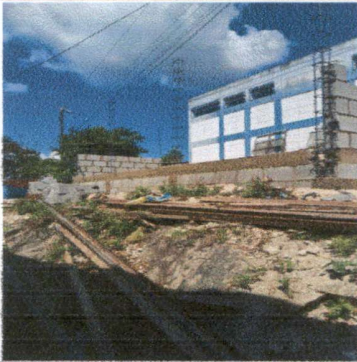
Foto 1: Inicial del levantado de muro para el aula que está en proceso de mejora