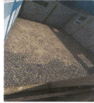
Foto 2: Preparación para reparación del entortado de cemento del aula