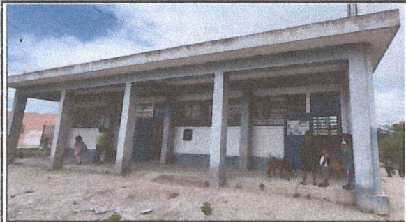
Foto 1: Fachada de la escuela con su apariencia actual, sin balcones en el ventanal frontal y pintura deteriorada.