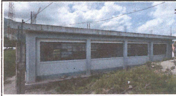
Foto 2: Parte posterior de la escuela con su apariencia actual, sin balcones en el ventanal, vidrios en mal estado y pintura deteriorada.