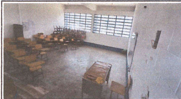
Foto 4: Interior de los salones con pintura en mal estado y problemas en el sistema eléctrico.