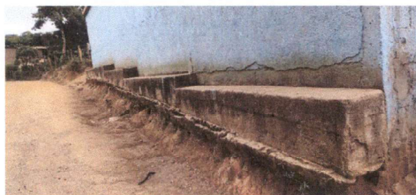
Foto 5: REPARACIÓN DE MUROS DE CONTENCIÓN. Reparación y Aplicación de sabieta en banquetas de concreto en interior y exterior del establecimiento educativo.