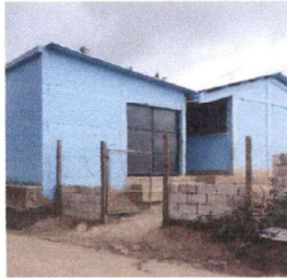
Foto 1: MANO DE OBRA ESPECIALIZADA (ALBAÑILERÍA, HERRERÍA, ELECTRICIDAD Y PLOMERÍA) Fabricación e instalación de portón de metal de ingreso