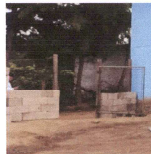
Foto 6: MURO. Reforzamiento y mampostería en paredes de portón de ingreso en muro perimetral de block

Observación: Si es necesario se pueden agregar hojas adicionales y actualizar el número de hojas.