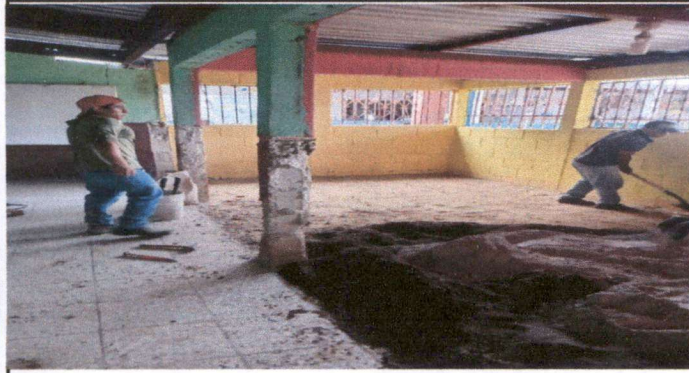
Foto1: Ampliación del Aula