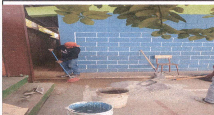
Foto 3: Fortalecer el muro perimetral, reparación de Banqueta, para que no se filtre el agua.