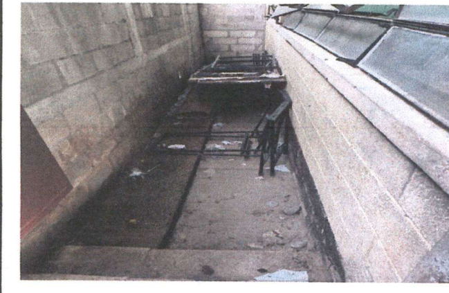
Foto 3: Fortalecer el muro perimetral, Reparación de Banqueta para que no se filtre el agua en el aula.