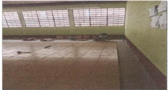
Sustitución de piso