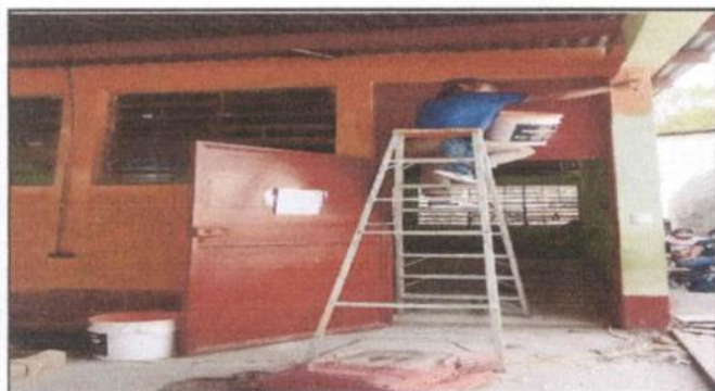
Pintura de interiores y exteriores