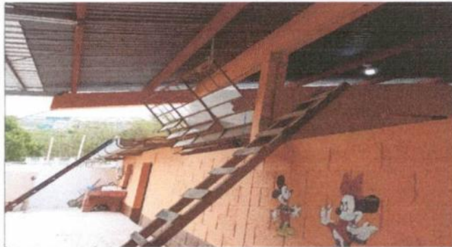
Sustitución de ventanas