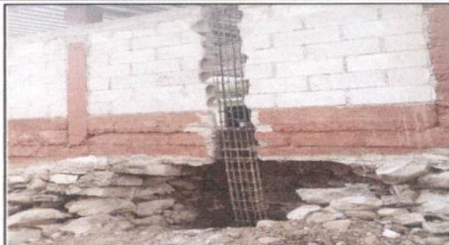
Reparación de Muros