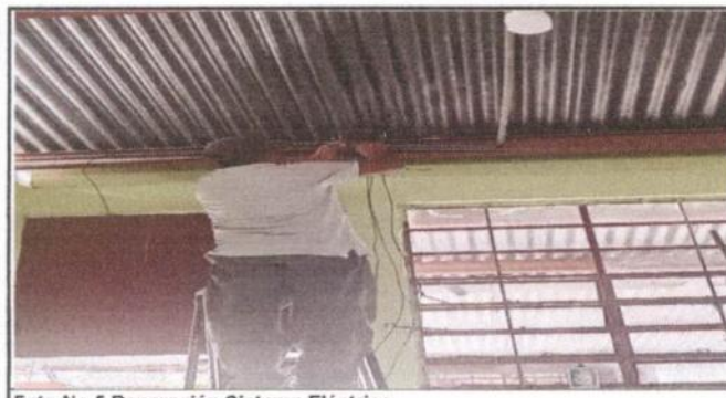
Foto No.5 Reparación Sistema Eléctrico