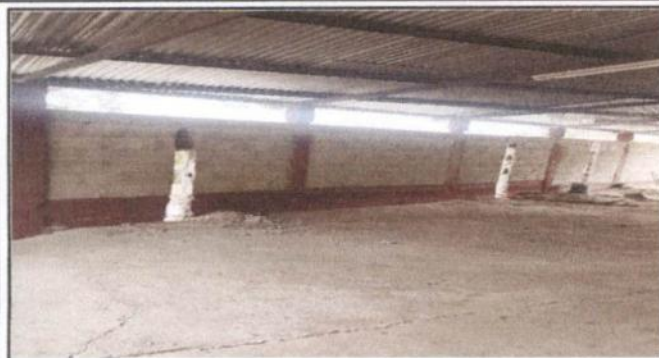
Reparación de Muros