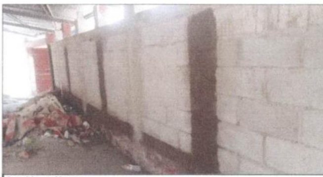
Cernido en Muros

Observación: Si es necesario se pueden agregar hojas adicionales y actualizar el número de hojas.