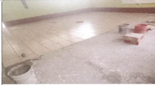
Sustitución de piso