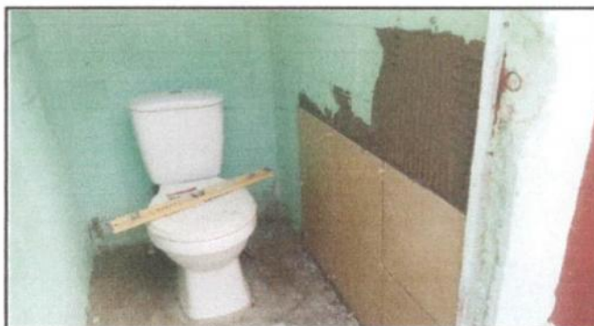
Azulejo en Sanitarios