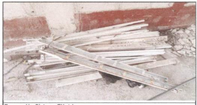
Reparación Sistema Eléctrico

Observación: Si es necesario se pueden agregar hojas adicionales y actualizar el número de hojas.