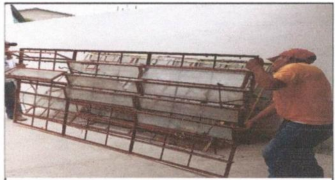
Sustitución de ventanas