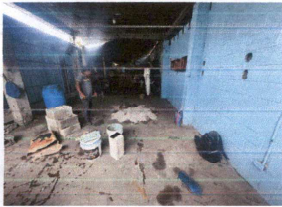
Foto 3: Instalación de piso cerámico para aula de quinto grado ubicada en el módulo tres del edificio escolar.