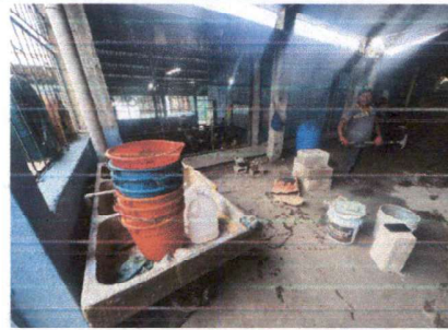
Foto 4: Instalación de muros para aula de sexto grado con acabados ubicada en el módulo tres del edificio escolar.