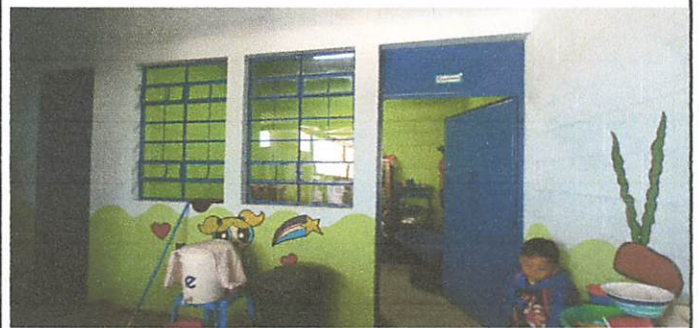
ampliacion de espacio de la cocina

Observación: Si es necesario se pueden agregar hojas adicionales y actualizar el número de hojas.