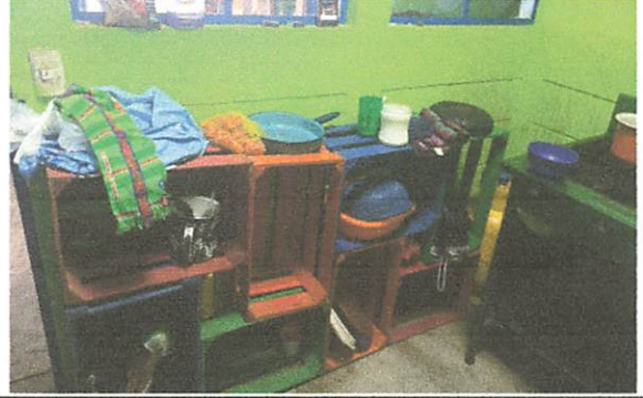
elaboracion de gabinetes inferiores