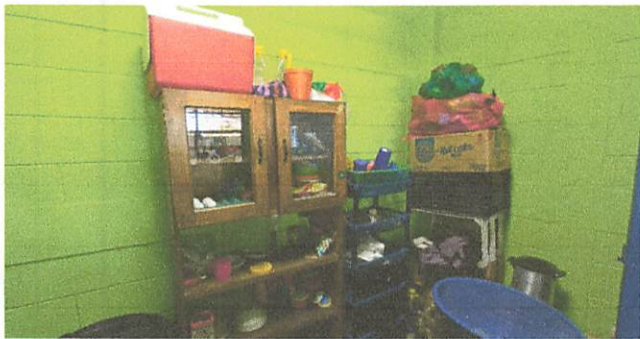
elaboracion de gabinetes aereos e inferiores para colocar utensilios de cocina