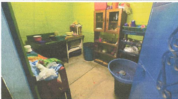
colocacion de piso en la cocina