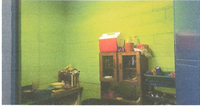
colocacion de un lavatrastos o pila de un labadero