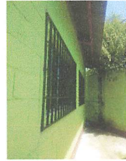
Foto 2: colocar vidrios en las ventanas y en la ventana de puerta, para cocina.