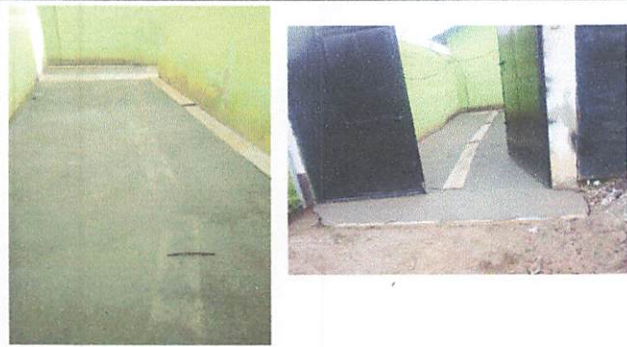
Foto 1: mantenimiento de portón principal y pavimento en el ingreso