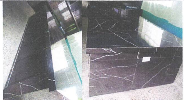
Foto 4: Instalación de una isla en el centro para guardar cosas y que sirva de mesa.