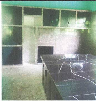
Foto 3: Instalación gabinetes de concreto forrado de azulejo para traslado de cocina.