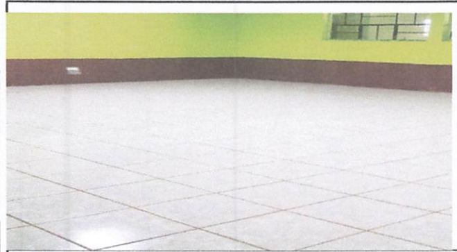
Foto1: piso nuevo