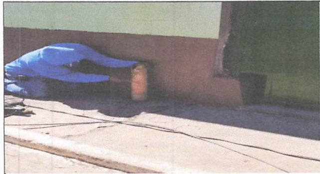
Foto1: componiendo el buzón