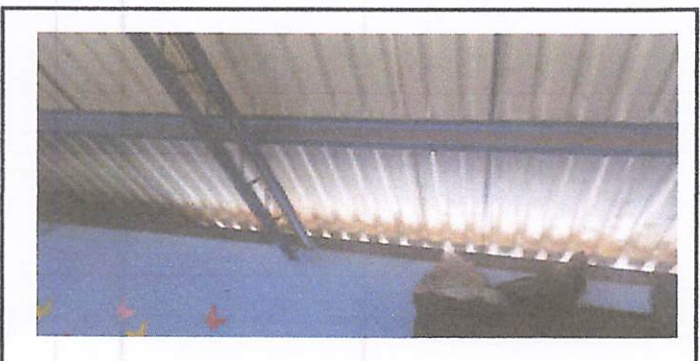
Foto 5: Cambio de laminas por deterioro y muchas goteras en el aula y revisar la coneccion electrica ya que estan quemados los gasneones.