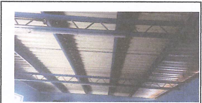
Foto 4: Cambio de techo por goteras y deterioro de lamina en el aula y revisar la coneccion electrica ya que estan quemados los gasneones.