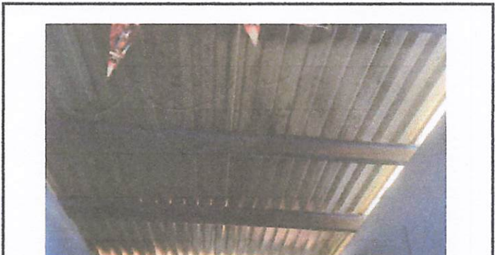
Foto 2: Cambio de techo por deterioro de la lamina en el aula y revisar la coneccion electrica ya que estan quemados los gasneones