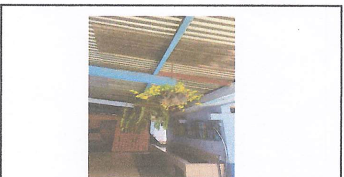
Foto 6: Cambio de techado por la lamina esta muy deteriorada en el pasillo de las aulas

Observación: Si es necesario se pueden agregar hojas adicionales y actualizar el número de hojas.