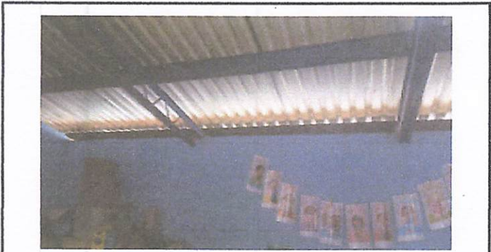
Foto 3: Cambio de techo por goteras en el aula y revisar la coneccion electrica ya que estan quemados los gasneones.