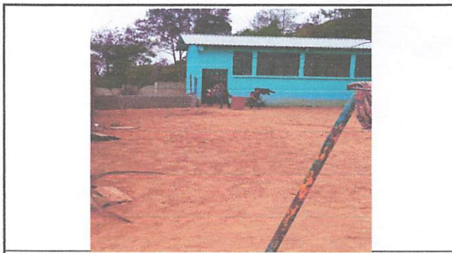
Foto 4: Patio con exceso de polvo, (aquí ya se había quitado la estructura de madera)