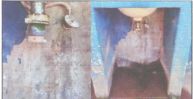
Foto 6: Tubería de lavamanos inexistente y por ende existencia de fugas de agua.

Observación: Si es necesario se pueden agregar hojas adicionales y actualizarlas con nuevas fotografías.