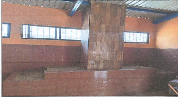
Foto1: COCOCINA RURAL FINALIZADA