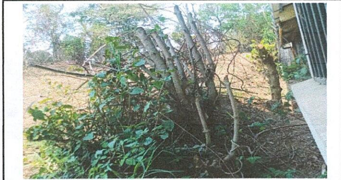
elaboracion de un muro perimetral de 33 metros de largo para la circulacion de la escuela.