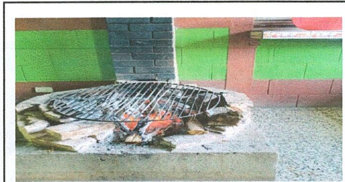
demolicion de estufa rural y elaboracion de una nueva estufa rural ( pollo )