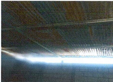
FOTO 3 INSTALACION ELECTRICA