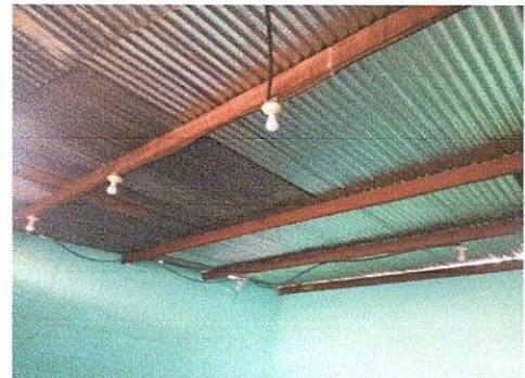
FOTO 4 INSTALACION DE FOCOS