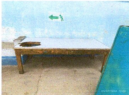
FOTOS 5 REPARACION DE MESAS CON FORMICA