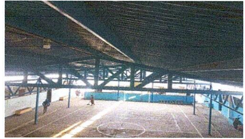
FOTO 2 BAJADAS DE AGUA