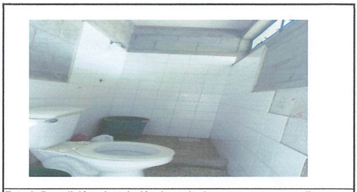
Foto 6: Demolición e instalación de sanitarios con puertas corredizas

Observación: Si es necesario se pueden agregar hojas adicionales y actualizar el número de hojas.