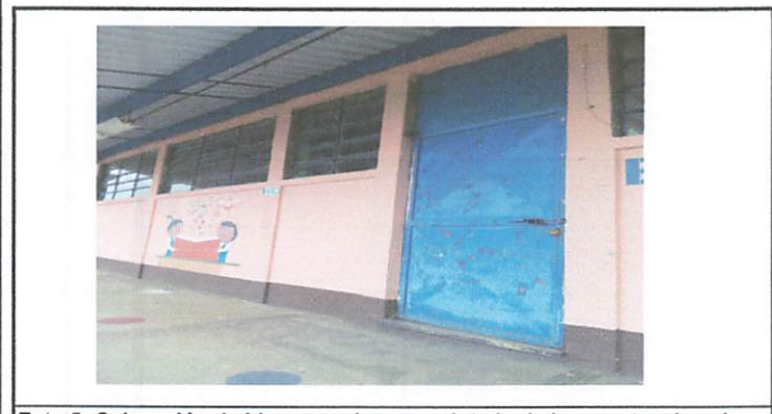
Foto 5: Colocación de bisagras, chapas y pintado de las puertas de aulas cocina y dirección