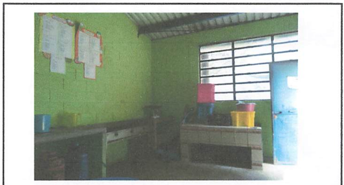
Foto 4: Repellar, Colocación de Azulejo y demolición de plancha de cocina