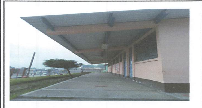
Foto1: Colocación de canales y bajadas de agua