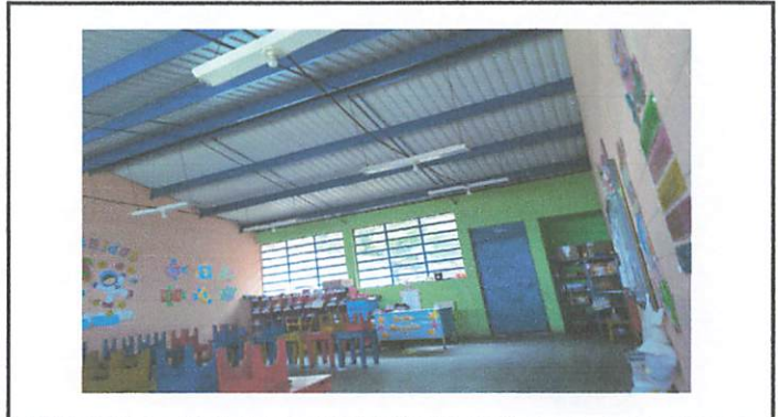
Foto 2: Cambio de instalación Electrica Aulas, Corredor, Dirección y Cocina