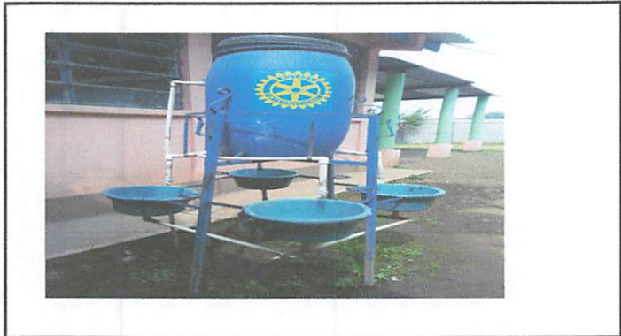
Foto1: Elaboración de lavamanos industriales con azulejo