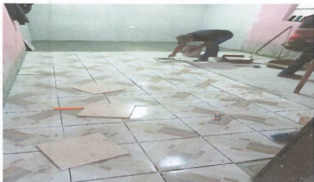
Foto 3: Colocación de piso cerámico en el salón de segundo primaria que fue ampliada