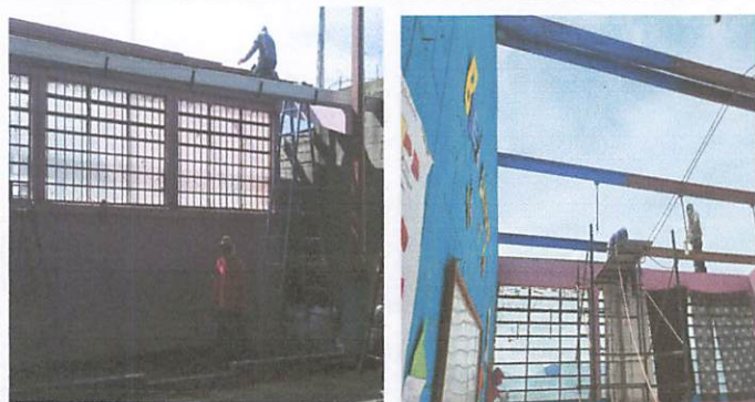
Foto 1: Colocación de techado nuevo en dos aulas, dirección, corredor y una bodega.