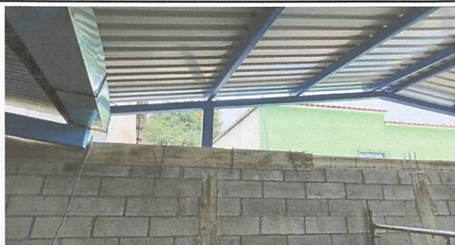
Foto 5: Colocar solera para reforzar pared que funciona como muro.