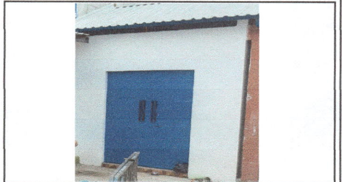
Foto 2: ENTRADA A COCINA, CON PUERTA DE METAL DE DOBLE HOJA, YA FINALIZADA