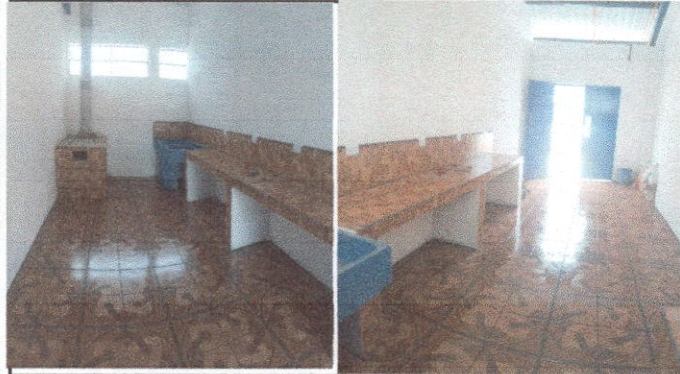
Foto 1: POLLO ARTESANAL, LAVADERO CON SISTEMA DE DRENAJE Y AGUA POTABLE Y MOLINERO AZUJEJIADO, COLOCACION DE PISO CERAMICO, Y REPELLO EN TODA LA COCINA