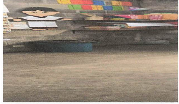
Colocación de piso en bodega.