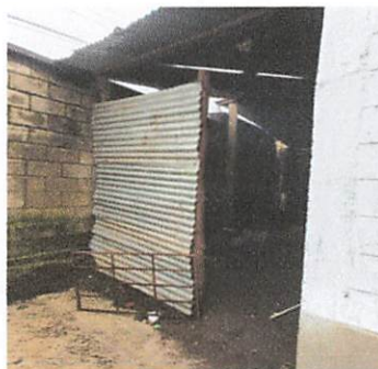
Instalación de cotina metálica en cocina.