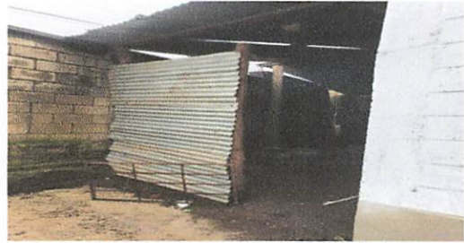
Instalación de puerta de cocina

Observación: Si es necesario se pueden agregar hojas adicionales y actualizar el número de hojas.