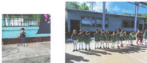
Pintura exterior de las aulas