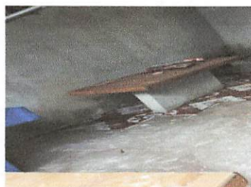
Instalación del purificador

Observación: Si es necesario se pueden agregar hojas adicionales y actualizar el número de hojas.