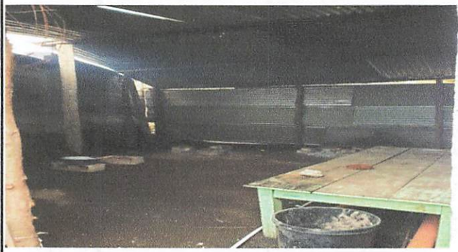
Colocación de piso en cocina