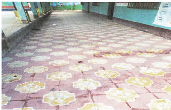
Colocación de piso en corredor de la escuela