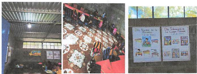
Pintura interior de las aulas