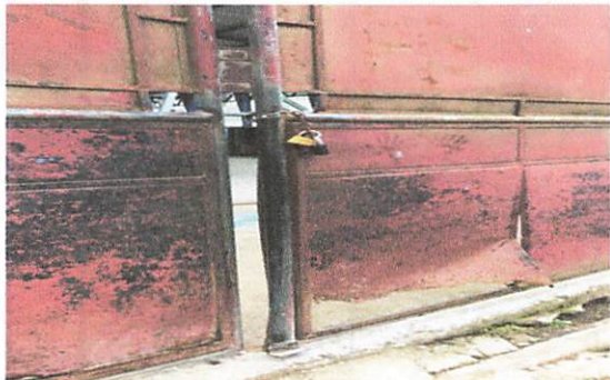
Colocación de portón