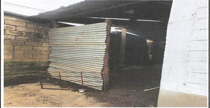
Colocación de techo en cocina