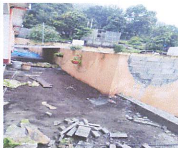
Foto1: Pasillo de la entrada donde se nivela el corredor