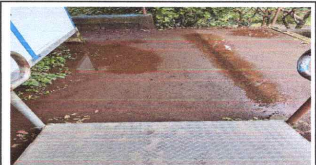
entrada de Aula módulo caidas de agua pavimentar.

Observación: Si es necesario se pueden agregar hojas adicionales y regularizar el número de hojas.