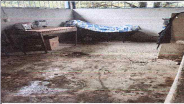
Foto1: Parte interna cocina remodelar, gabinetes, mesas de azulejos, piso ceámico etx