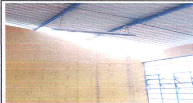
laminas de escuela de pávulos dañados por vientos (parcial) sistema eléctrico