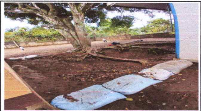
Foto 4: Caída de agua levantar mur,o para proteger cimienos y evitar erosión